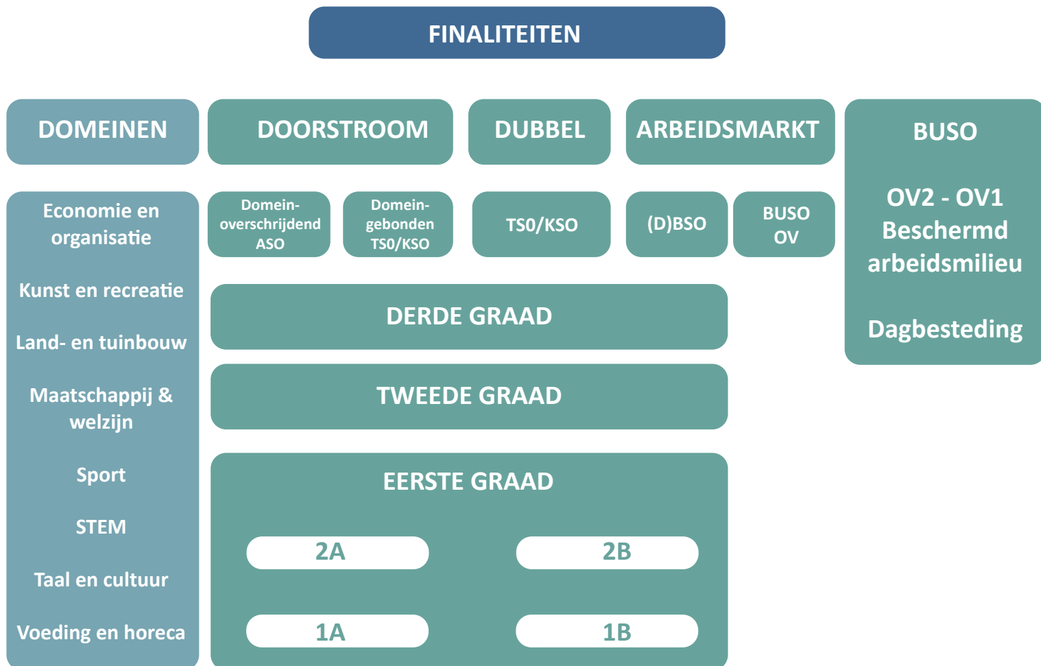
Figuur 1: Structuur secundair onderwijs na de onderwijshervorming 3

In het schooljaar 2024-2025 is de hervorming van het secundair onderwijs aanbeland in het 2de jaar van de 3de graad.